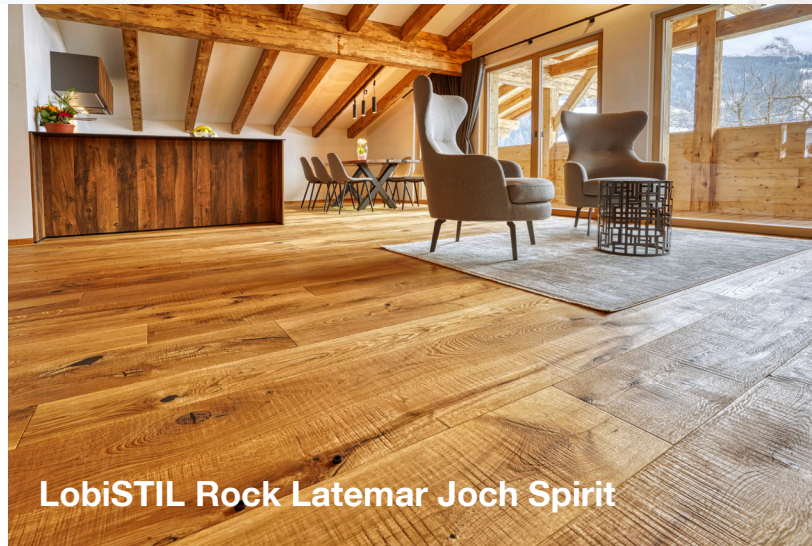
LobiSTIL Rock Latemar Joch Spirit

LobiSTIL Rock löst sich von den typischen industriell-gefertigten Oberflächen und lehnt sich an die rauen, unregelmäßigen Oberflächen vergangener Tage an.