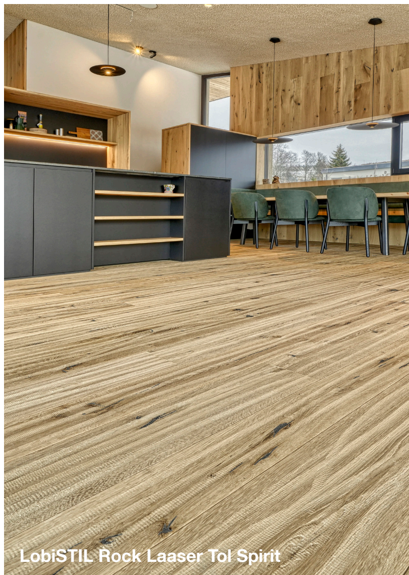
LobiSTIL Rock Laaser Tol Spirit