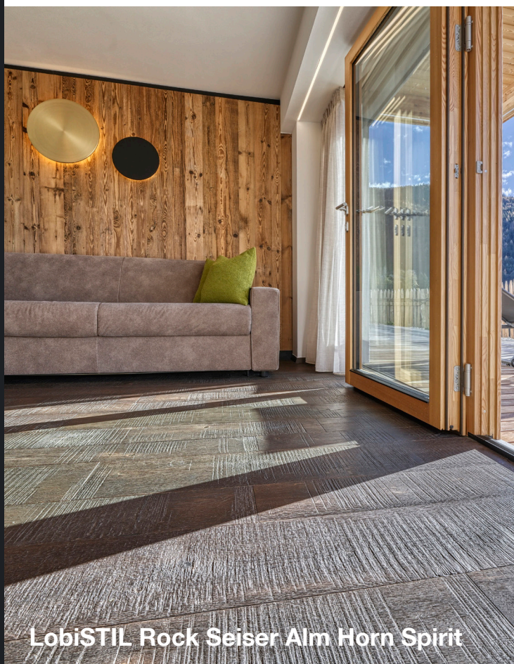
LobiSTIL Rock Seiser Alm Horn Spirit